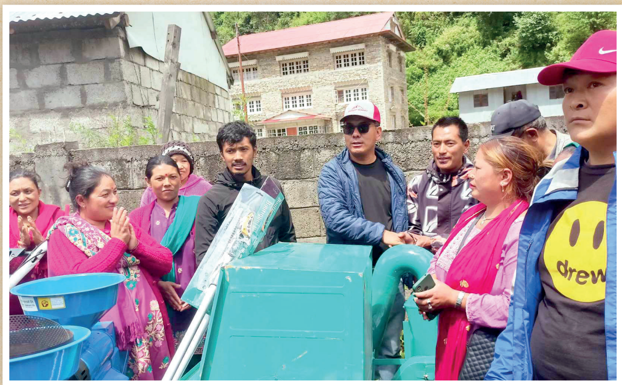
सोलुदुधकुण्ड नगरपालिकाको वडा नं. २ लाई कृषि यान्त्रिकरण घोषणा कार्यक्रम ।