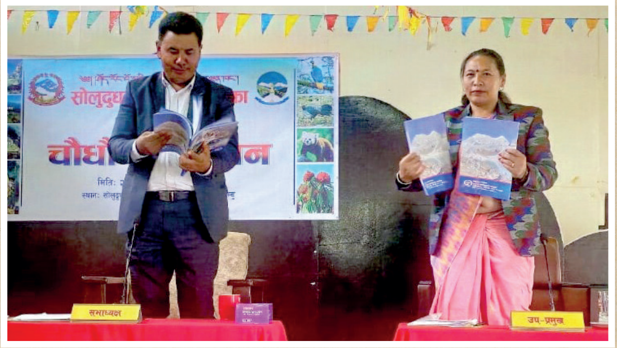
१४ औं नगरसभाको अधिवेशन तथा “सोलुदुधकुण्ड नगरपालिकाको ५ वर्ष” नामक पुस्तक विमोचन कार्यक्रम