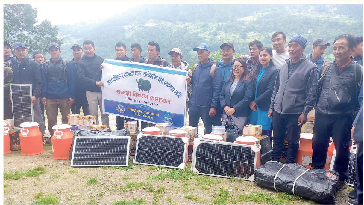
चौरी प्रवर्धनका लागि सामग्री बितरण कार्यक्रम