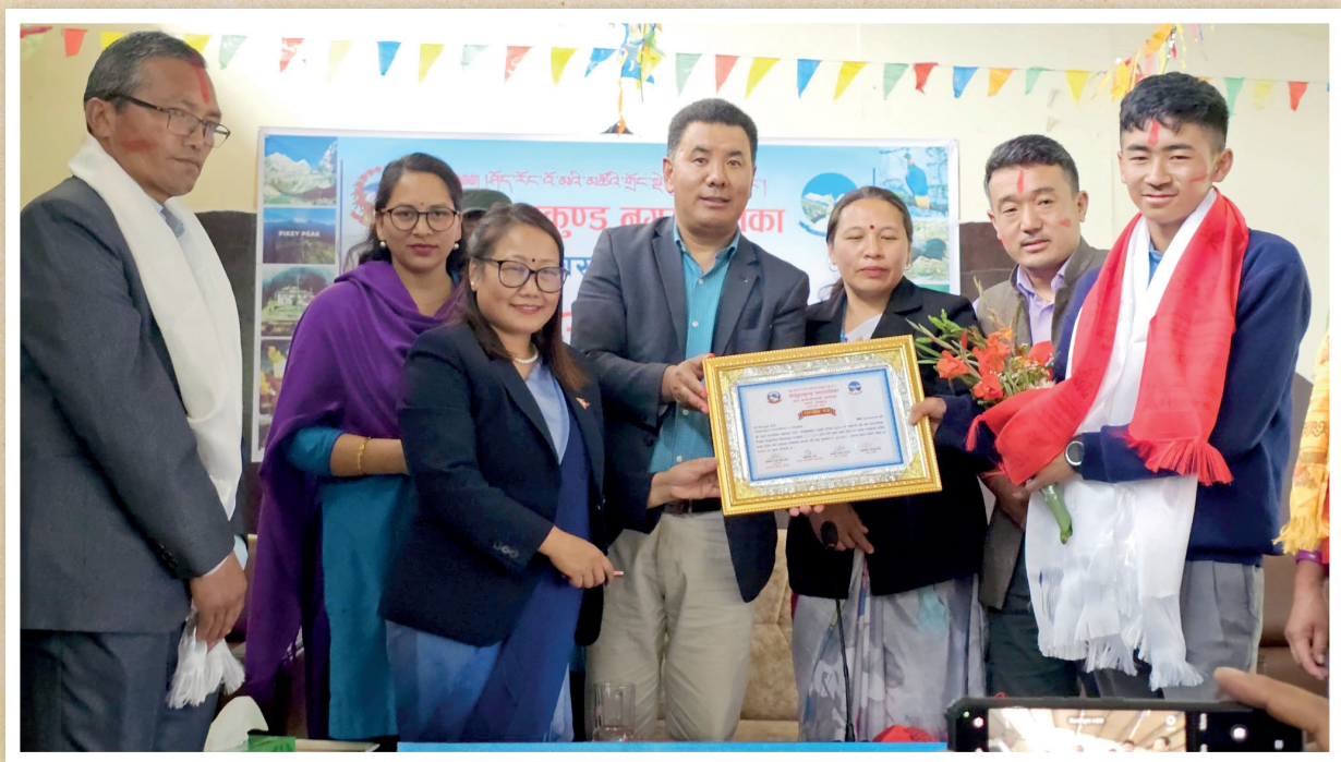
एस.ई.ई. परीक्षा २०८० मा उत्कृष्ट विद्यार्थीलाई पुरस्कार तथा सम्मान कार्यक्रम ।