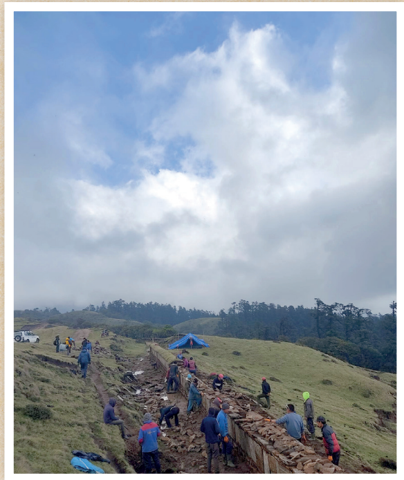
प्रधानमन्त्री रोजगार कार्यक्रमअन्तर्गत सडक सोलिड (बायाँ) तथा स्थानीय मानेहरुको मर्मत तथा संरक्षण (दायाँ)