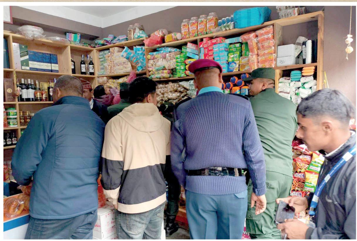
सोलुदुधकुण्ड नगरपालिकाको नियमित बजार अनुगमनको झलक