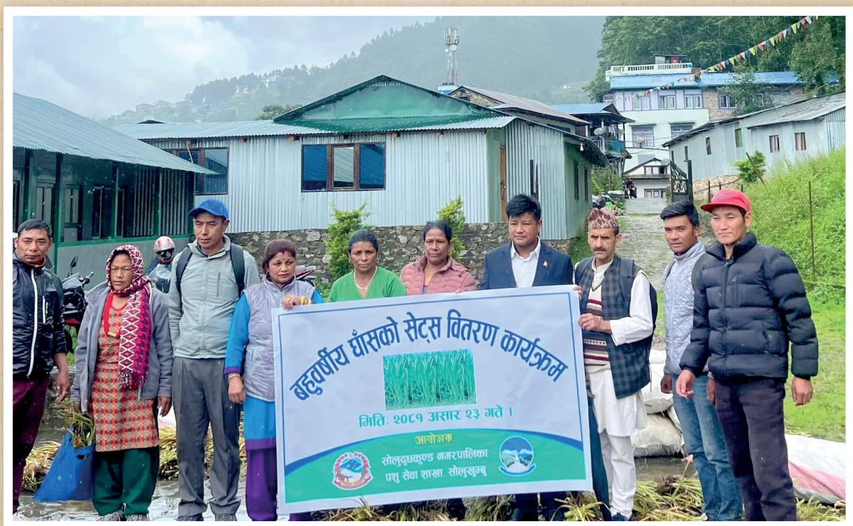
कृषकहरुको सहयोगको लागि बहुवर्षीय घाँसको सेट्स बितरण